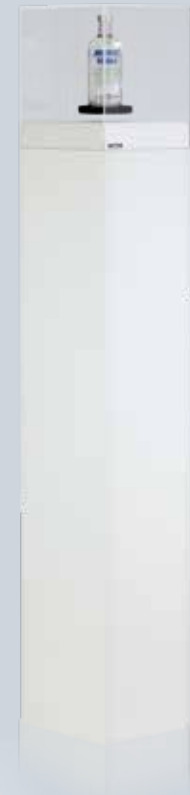
155 cm hohe Säule für Präsentation auf Augenhöhe