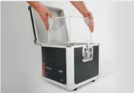
Flightcase für Plexiglashaube