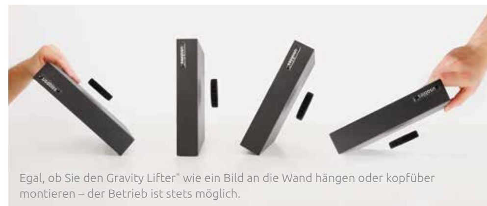
Egal, ob Sie den Gravity Lifter® wie ein Bild an die Wand hängen oder kopfüber montieren – der Betrieb ist stets möglich.

Alle Produkte sind mit ihrer Schwebefunktion sehr sparsam im Verbrauch (ein Zehntel einer 60-Watt-Glühlampe oder weniger). Für den Einsatz auf Verkaufsflächen sind alle Geräte für den 24/7/365-Dauerbetrieb ausgelegt.