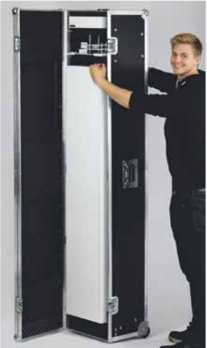
Flightcase für Gerät und Säule