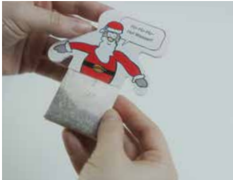
Alle Sinne ansprechen