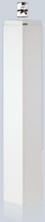
155 cm hohe Säule für Präsentation auf Augenhöhe